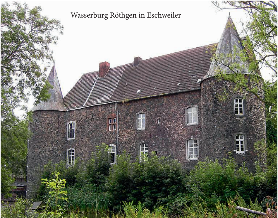
Wasserburg Röthgen in Eschweiler